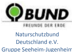
Naturschutzbund Deutschland e.V. Gruppe Seeheim-Jugenheim