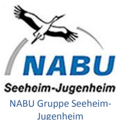
NABU Gruppe Seeheim- Jugenheim