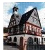
Museumsverein Burg Tannenberg